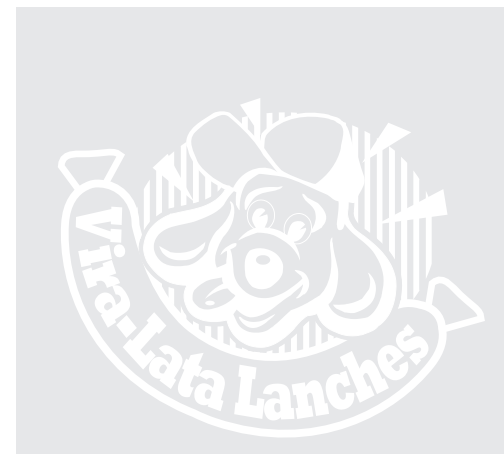
Versão em negativo